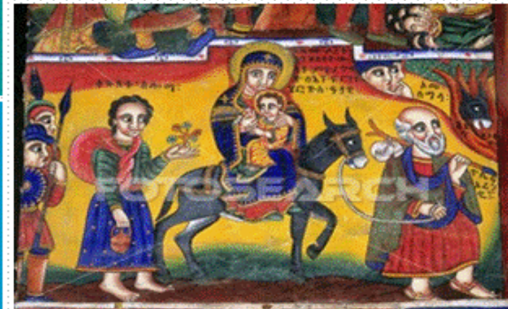
እነርሱም ከሄዱ በዓለ አንሆ፣ የጌታ መልአክ በሐልሞ ሰዮሴፍ ታይቶ፣ ሄሮድስ ሐዘን ሊገደገው ይፈልገዋልና ተነሣ፣ ሐዘንንና እናቱንም ይዞ ወደ ግብፅ ሸሽ፣ እስከከግርሀም ድረስ በዚያ ተቀመጥ አሰው። (ማቴዎስ ወንጌል 2:13)